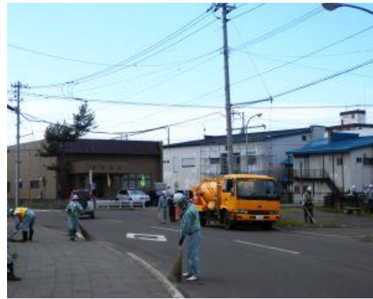
町内清掃活動 (地域貢献)