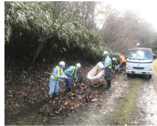
公園清掃活動 (現場地域貢献)