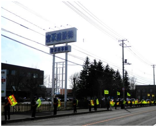
交通安全の呼掛け