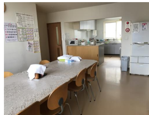
社員寮の外観及び部屋の内装